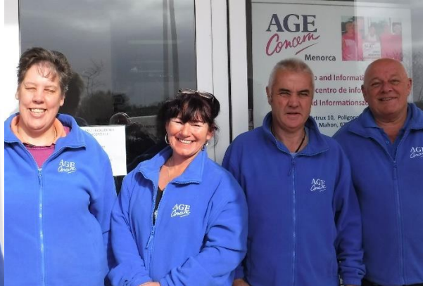
Algunos de nuestros voluntarios con sus uniformes de invierno